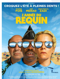
L'ANNÉE DU REQUIN 14 Avril - 19h30 Gratuit