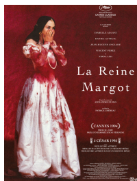
LA REINE MARGOT 7 Avril - 19h30 Gratuit