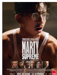
MARTY SUPREME 27 Avril - 19h30 750 FDJ