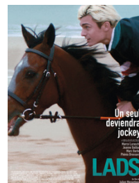
LADS 28 Avril - 19h30 Gratuit