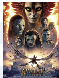
AVATAR, DE FEU ET DE CENDRES 20 Avril - 19h30 750 FDJ