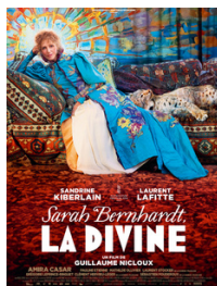
SARAH BERNHARDT, LA DIVINE 21 Avril - 19h30 Gratuit