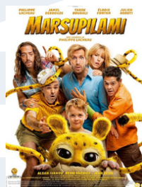
LE MARSIPULAMI 18 Avril 16h30 & 18h30 500 FDJ Enfant 750 FDJ Adulte