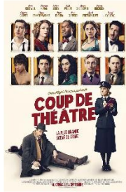
COUP DE THÉÂTRE